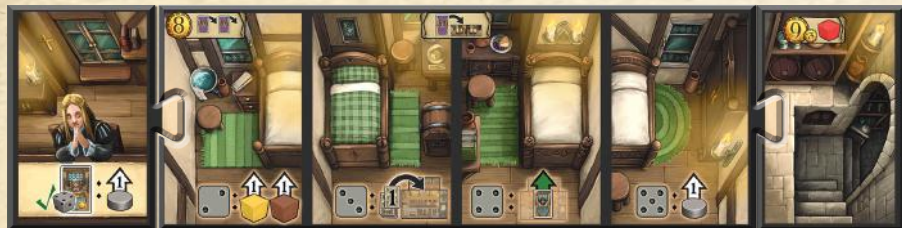
Modul A (Weinkeller)