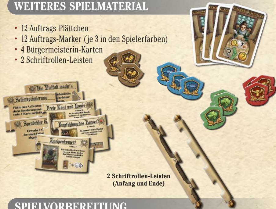
2 Schriftrollen-Leisten (Anfang und Ende)