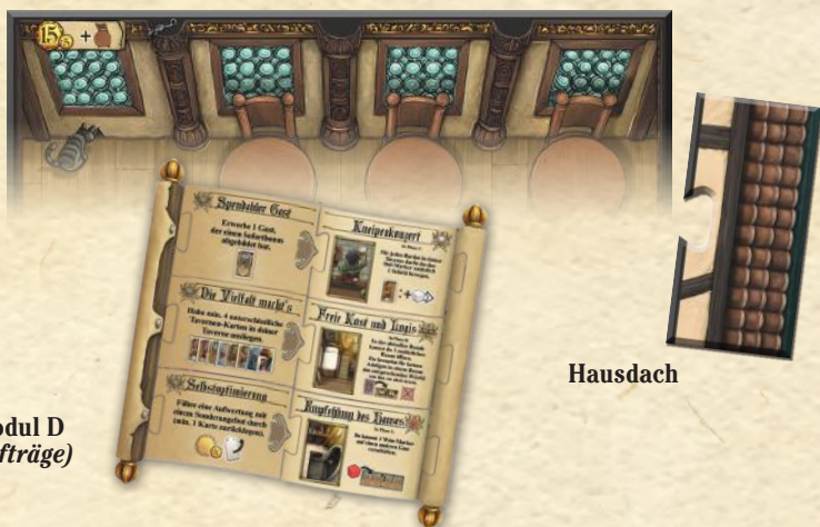
Modul D (Aufträge)