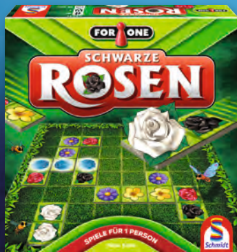
Schwarze Rosen 49431