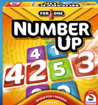
Number UP 49433