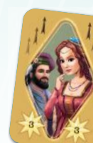
Kleine und große Dogatkarte