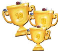
8 Käferpokale (werden nur für die Team- Variante benötigt)