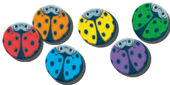
24 Käfer (4 Sets in 6 Farben)